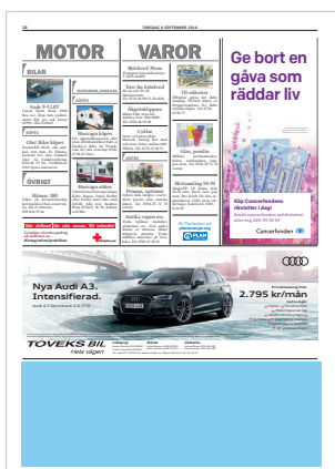
Kvartssida, modul 62, 248x88 mm