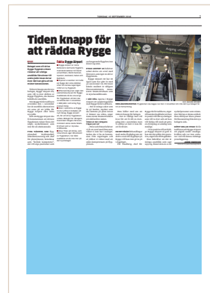
Halvsida, modul 64, 248x178 mm