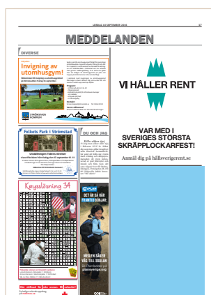
Kvartssida, modul 34, 122x178 mm