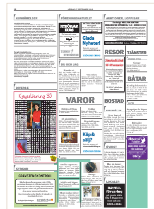
Modul 12, 38x88 mm