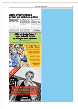
Halvsida, modul 38, 122x360 mm