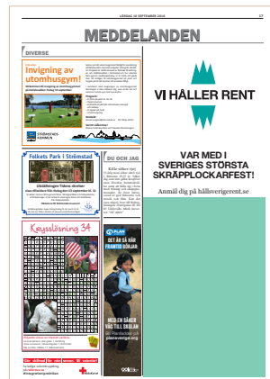
Modul 34, 122x178 mm