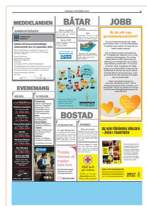
Rink, modul 61, 248x43 mm